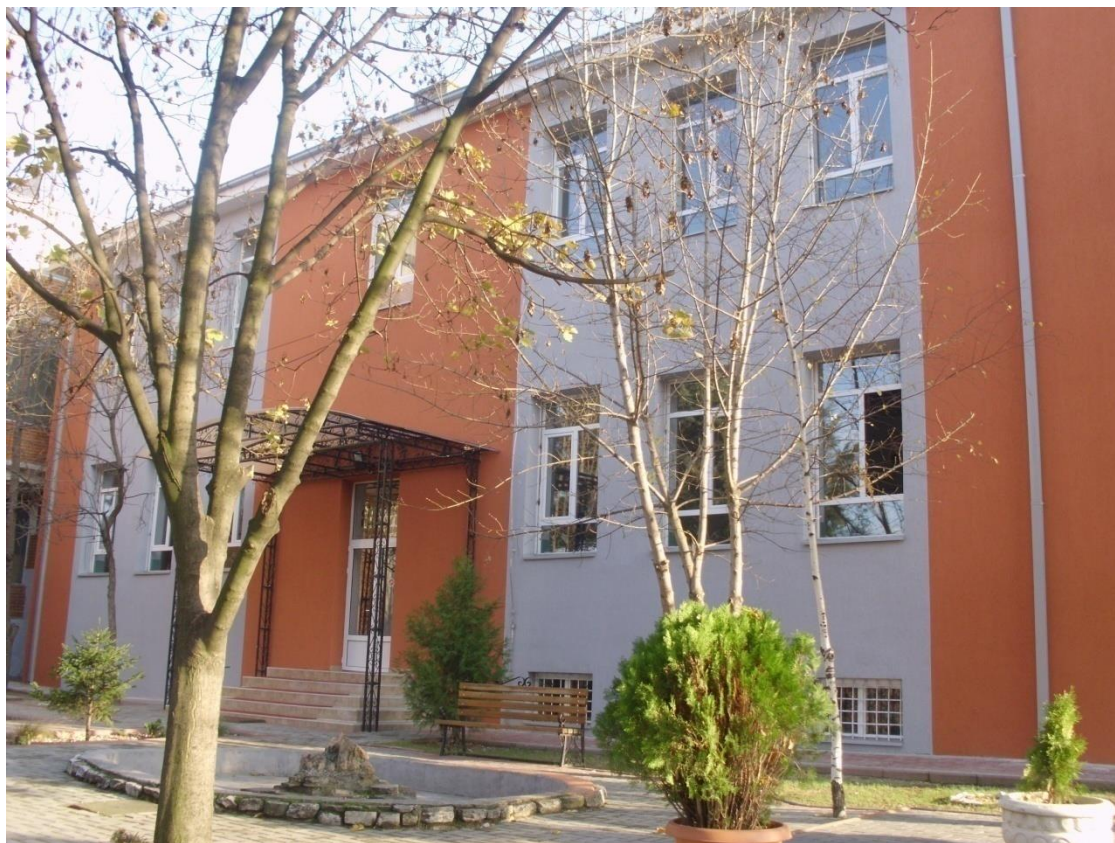
Неготино, август, 2019